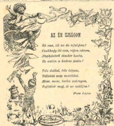
Az Én Ujságom első számának címlapja

száma, ilyen kedves, szép címlappal, mint a mellékelt képen láthatjátok.